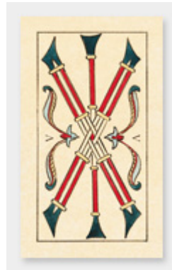
Cinq de Bâtons

Les événements, situations, circonstances de votre vie