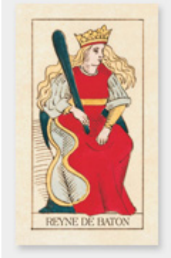
Reine de Bâtons