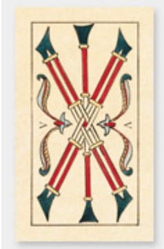
Cinq de Bâtons