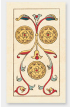
Trois de Deniers